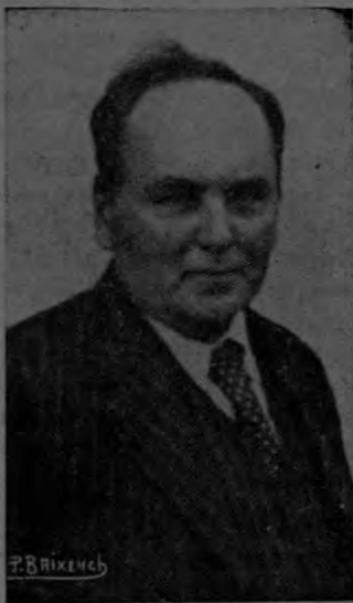
Don Joaquín García Monge Director de Repertorio Americano